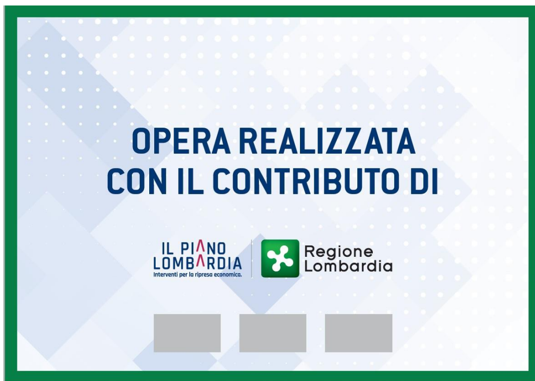
MODELLO DI TARGA IN CASO DI PARTNER